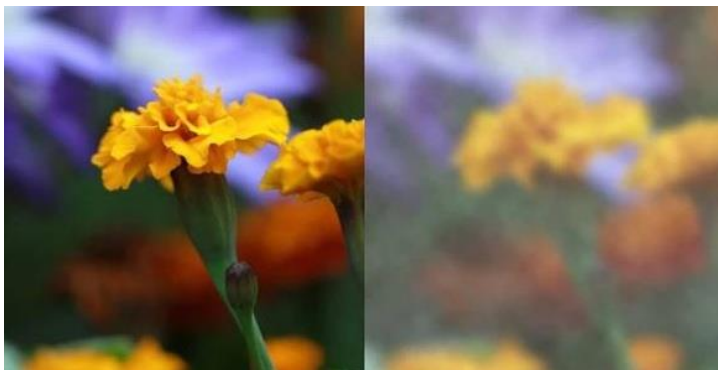
Pohled zdravým okem